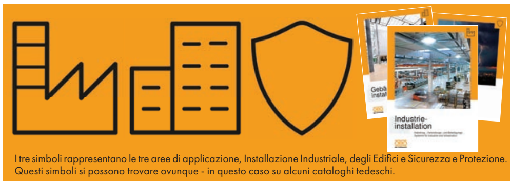
I tre simboli rappresentano le tre aree di applicazione, Installazione Industriale, degli Edifici e Sicurezza e Protezione. Questi simboli si possono trovare ovunque - in questo caso su alcuni cataloghi tedeschi.