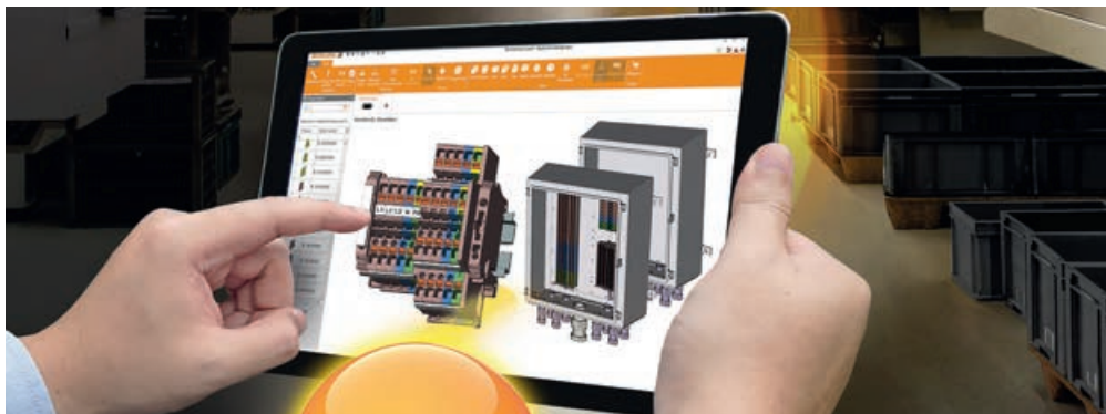
Ecco un configuratore di Weidmüller. Con l'interfaccia ELBRIDGE abbiamo ora uno standard che consente una facile collaborazione tra produttori, grossisti e installatori su Internet.

I configuratori online semplificano la nostra giornata di lavoro. Con ELBRIDGE è stato creato in Germania uno standard in modo che i produttori, i grossisti e gli installatori possano collaborare in modo più semplice.