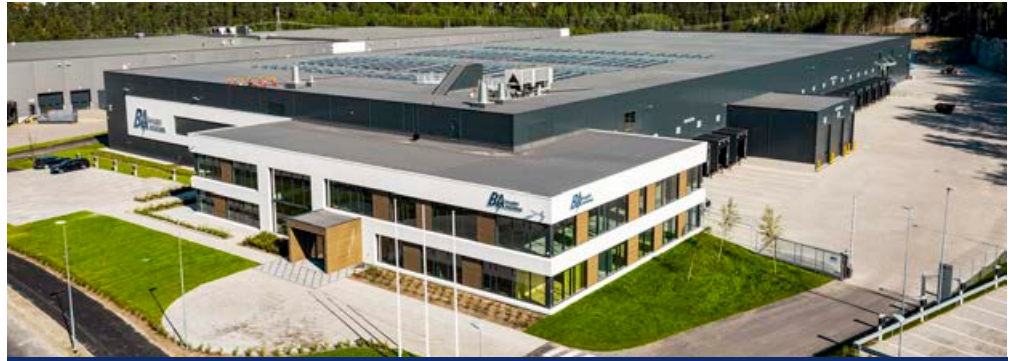
Il quartier generale inaugurato ad Oslo nel 2019 - ultra-moderno e il più possibile rispettoso dell'ambiente.

L'ambizione di FEGIME in Norvegia è quella di gestire il settore dell'energia solare. In occasione della recente sessione "migliori pratiche" online hanno mostrato quello che stanno facendo.