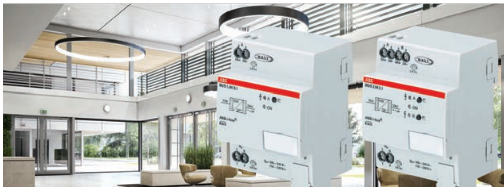
I due Gateway premium di ABB, KNX DALI sono certificati DALI 2 - e secondo ABB sono i soli prodotti con questa certificazione.

I due nuovi Gateway premium DALI di ABB non solo forniscono un'illuminazione migliore - ma combinano anche due importanti standard per la domotica.